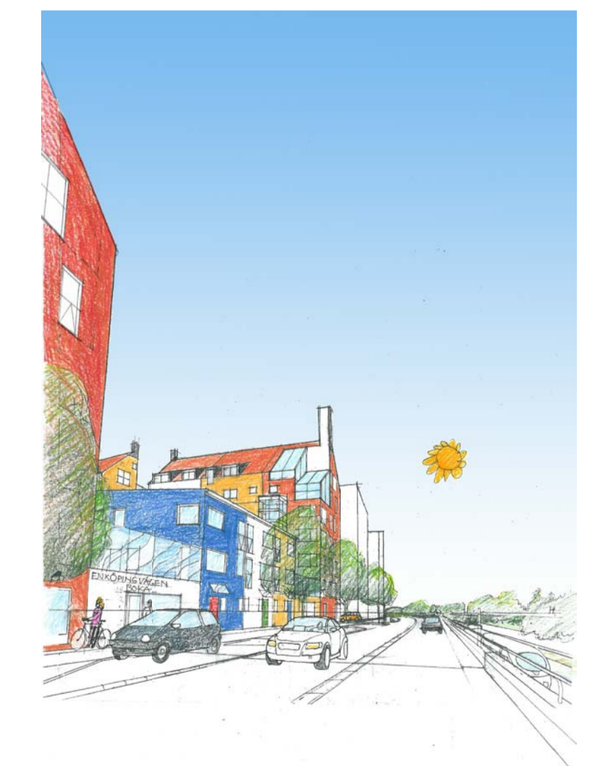
Illustration på kvarter 5 mot Enköpingsvägen med kvarter 3 i bakgrunden / Arken Arkitekter