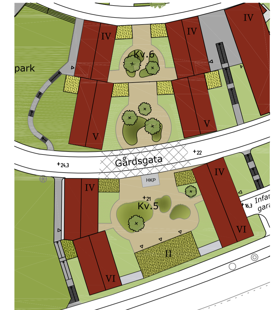
Illustration på föreslagen gårdsutformning, kvarter 5 och 6 / Arken Arkitekter och SWECO

Detaljplan för del av KUNGSÄNGENS KYRKBY 2:1 m.fl. (Ringvägen) del 2 Kungsängen, Upplands-Bro kommun