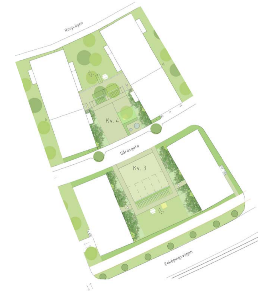
Illustration på föreslagen gårdsutformning, kvarter 3 och 4 / Amneby Forslund