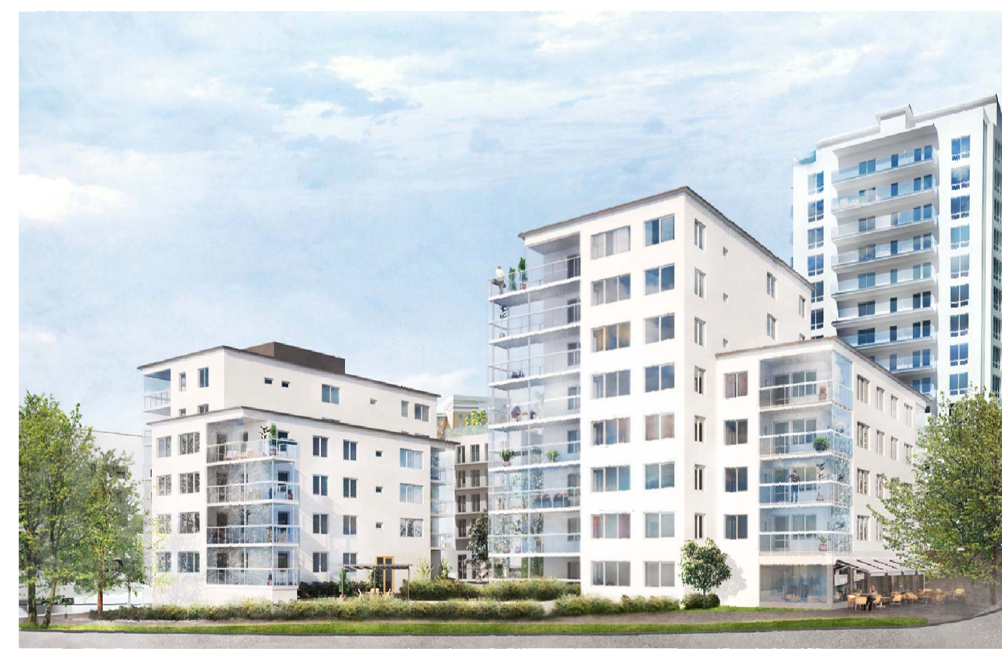
Illustration på kvarter 1 från Enköpingsvägen / ETTTELVA