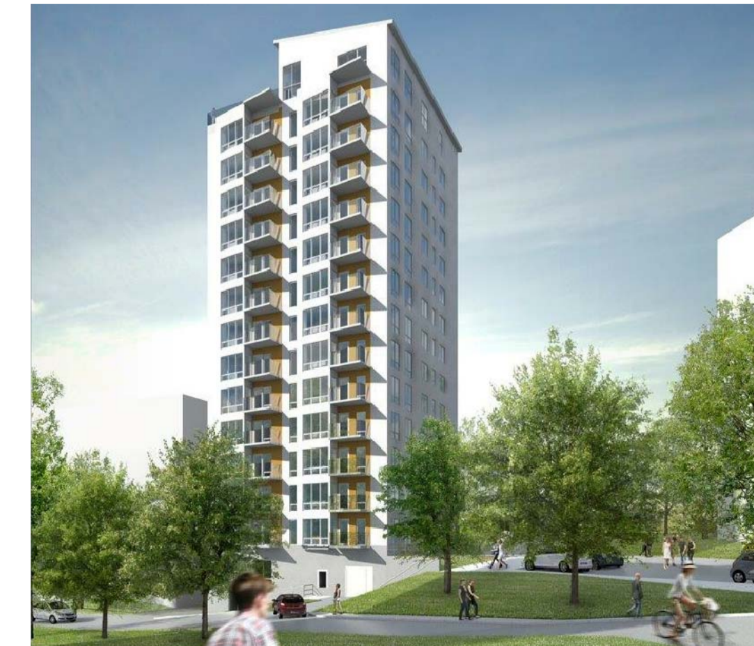
Illustration på kvarter 2 från Centrumvägen / Brunberg & Forshed