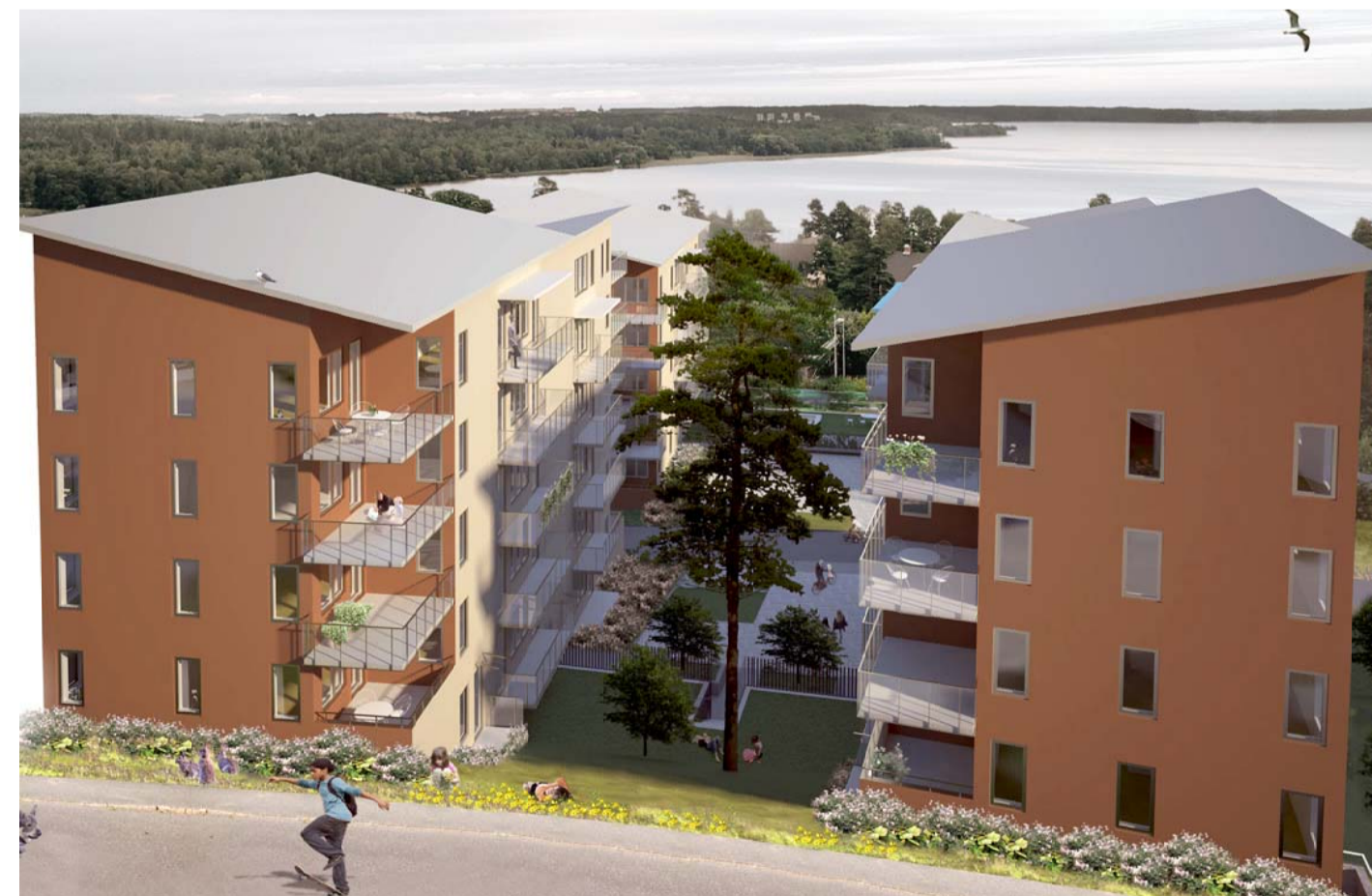
Illustration på kvarter 4 mot Enköpingsvägen / Amneby Forslund