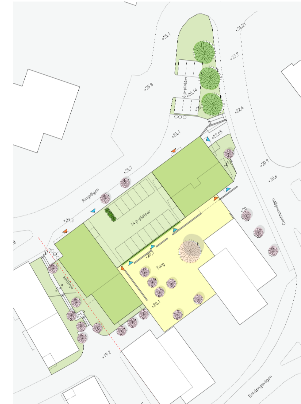
Illustration på föreslagen gårdsutformning, kvarter 1 och 2 / Brunberg & Forshed och ETTTELVA